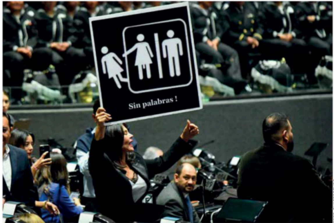
La bancada de Acción Nacional la respaldó y pidieron respetar la libertad de expresión de la legisladora