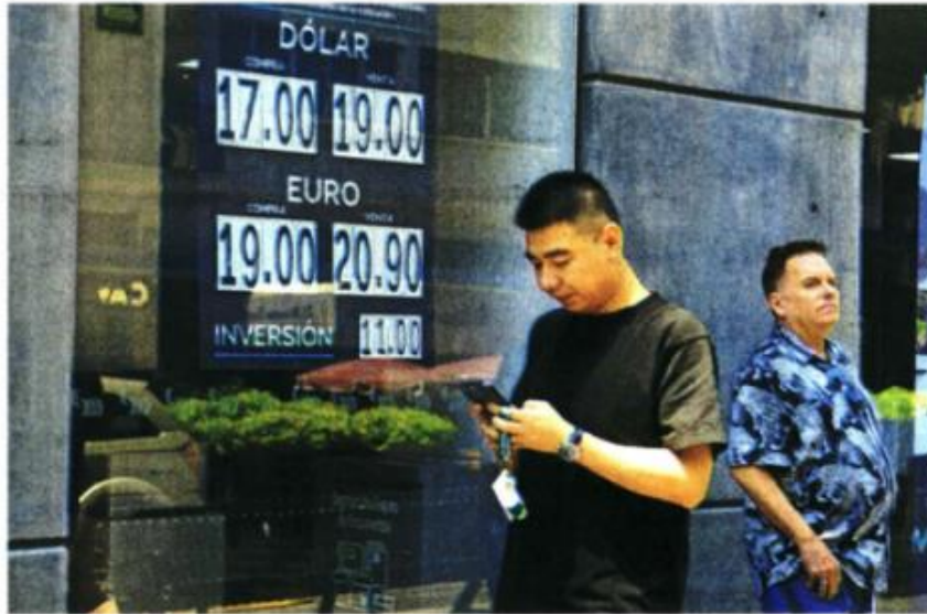
De acuerdo con bancos, el dólar al menudeo terminó la semana en 18.60 pesos a la venta, casi 1.15 unidades más que el cierre del viernes previo a las elecciones.

mana, el tipo de cambio alcanzó el máximo de 18.46 pesos por dólar luego de que AMLO dijera en su conferencia de prensa que el Poder Judicial está tomado por una minoría, enviando la señal de que impulsará esa reforma antes de terminar su mandato.