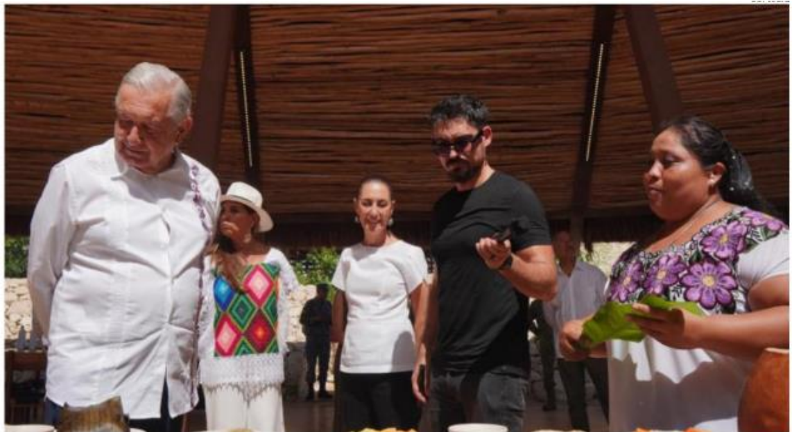
El presidente Andrés Manuel López Obrador, acompañado de Claudia Sheinbaum, en sus últimos días como jefe del Ejecutivo.

A 23 días de dejar la silla presidencial, López Obrador inauguró el Parque Nacional del Jaguar y Museo de la Costa Oriental, en Tulum, Quintana Roo, donde dijo que esta refor-