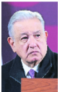
FERNANDA ROJAS. EL UNIVERSAL

:::: Nos cuentan que, en San Lázaro, Morena se despachó con la cuchara grande, pues logró que 95% de las iniciativas de reforma que envió el presidente Andrés Manuel López Obrador se fueran para su dictaminación a comisiones presi-