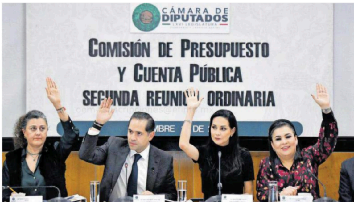
Los diputados de la Comisión de Presupuesto avalaron los recortes.