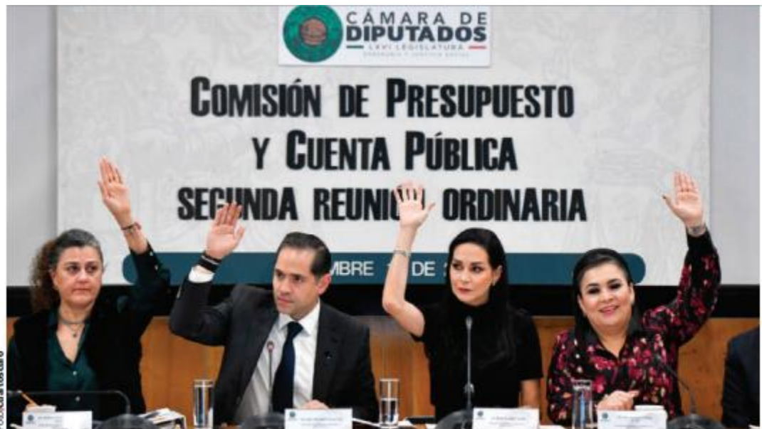
VOTACIÓN en la Comisión de Presupuesto y Cuenta Pública de San Lázaro, ayer.

Mil millones de pesos se reducirán al Poder Judicial