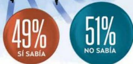
GRÁFICO: IVÁN DARRERA

• LA PRESIDENTA CLAUDIA SHEINBAUM PARDO PUBLICÓ EL JUEVES 31 DE OCTUBRE EL DECRETO DE LA REFORMA DE SUPREMACÍA CONSTITUCIONAL, CON LA CUAL SE BUSCA QUE LAS REFORMAS A LA CONSTITUCIÓN NO SE PUEDAN IMPUGNAR. ANTES DE QUE SE LO MENCIONARA, ¿USTED SABÍA ESTO?