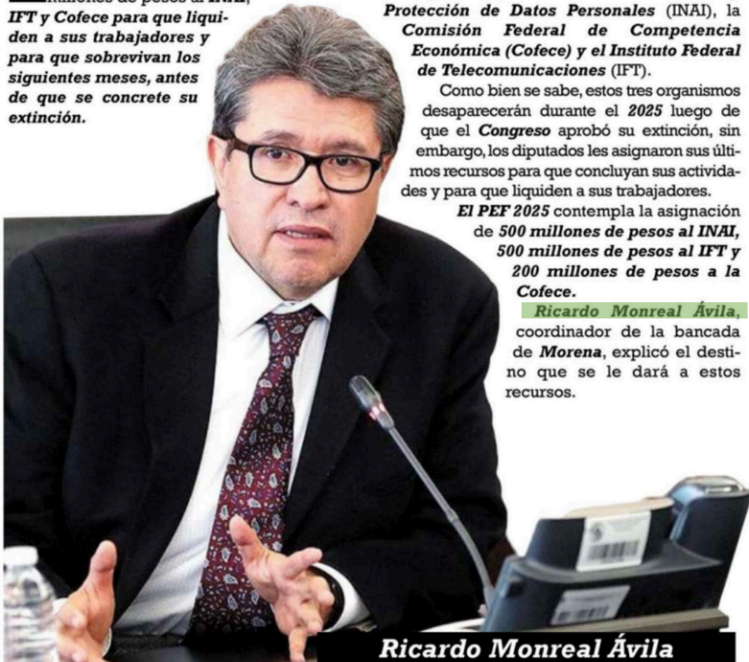
Ricardo Monreal Ávila

L os diputados de Morena y sus aliados decidieron asignarle poco más de mil millones de pesos al INAI , IFT y Cofece para que liquiden a sus trabajadores y para que sobrevivan los siguientes meses, antes de que se concrete su extinción.