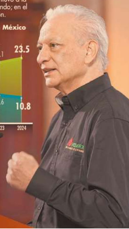
Víctor Rodríguez, director general de Pemex, expuso este miércoles los planes de inversión de la empresa pública del Estado.