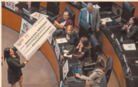
La oposición criticó que la nueva empresa constructora usará recursos en la opacidad.