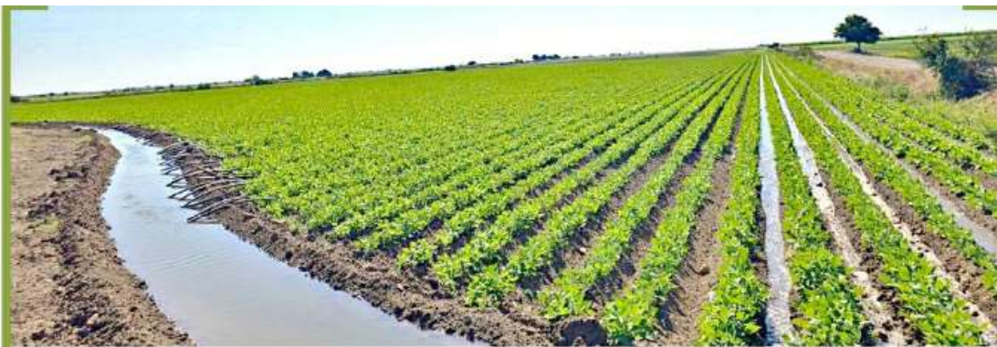
■ La producción agrícola en Sinaloa se ha visto afectada también por la sequía.

Entre 2018 y 2020 el precio de la papa alpha (de Sinaloa), rondó entre 14 y 16 pesos por kilo. Para 2023 y 2024, se disparó a entre 18 y 22 pesos, aunque la cosecha se mantenga bajo los mismos niveles, alrededor de las 375 mil toneladas de producción. ■