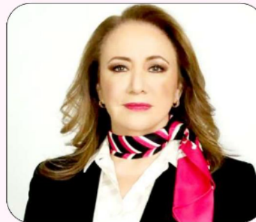
Yasmín Esquivel Mossa

Lista final de 4 mil candidatos a la elección del Poder Judicial