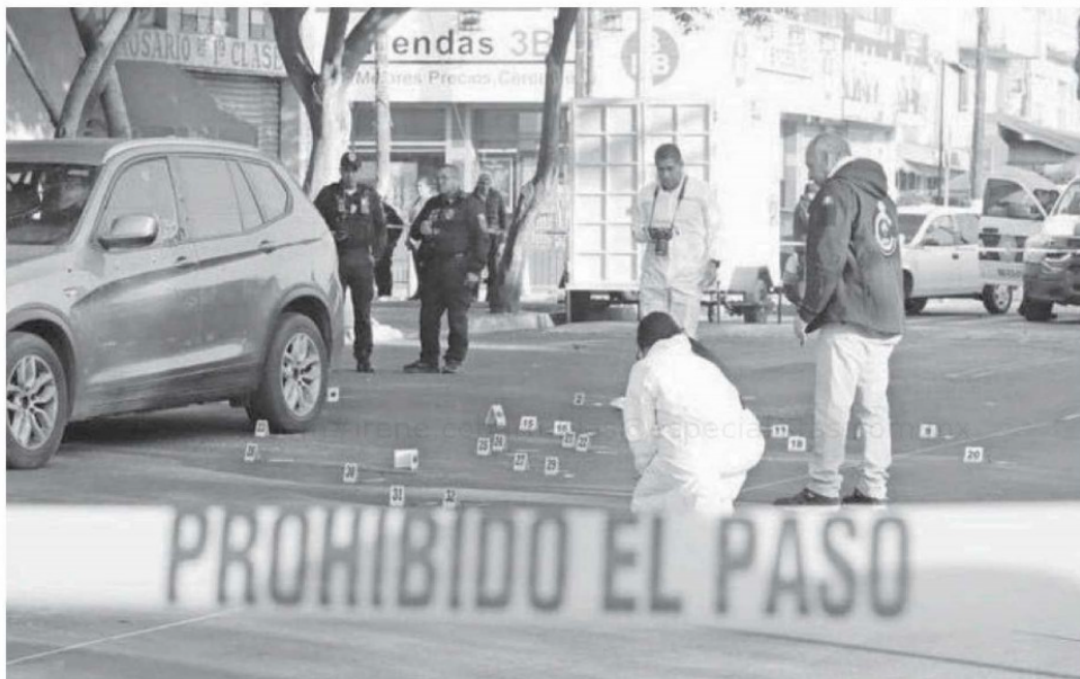
El pasado sábado asesinaron a un hombre y una mujer, en la Ciudad de México