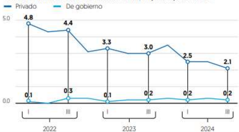
■ Contribución trimestral al crecimiento del PIB, en puntos porcentuales