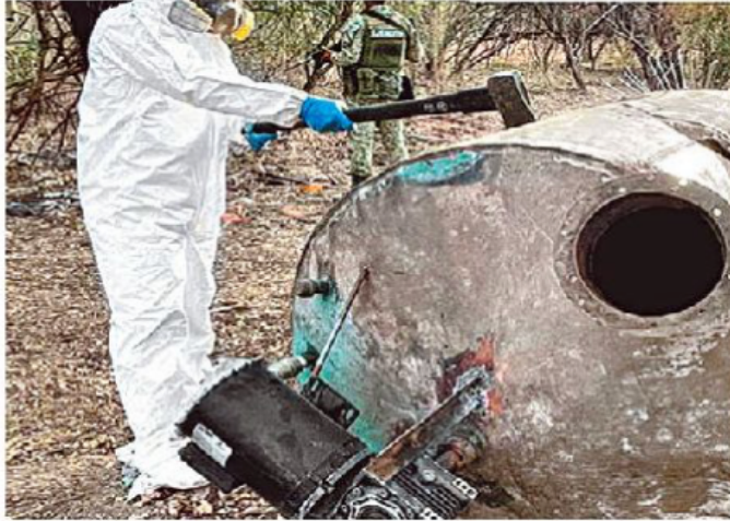
Militares localizan precursores para drogas sintéticas.

cártel de Sinaloa, una de las dos organizaciones señaladas por Washington como las culpables de la mayoría de cargamentos de fentanilo y demás drogas sintéticas que cruzan por la frontera norte del país.