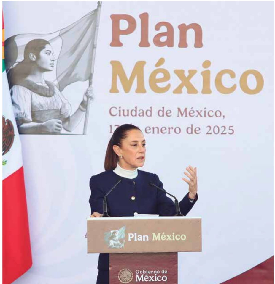
Afirmó Claudia Sheinbaum que con el plan que desarrolla su gobierno, se ha contabilizado la inversión y el número de empresas que quieren instalarse en México.

Por su parte, se espera una participación activa del sector