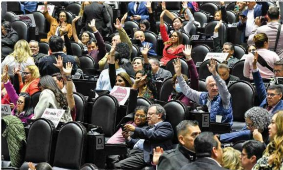
• FINAL. En San Lázaro, tras acusaciones, los legisladores votaron por desaparecer siete órganos, con 347 votos a favor y 128 en contra.