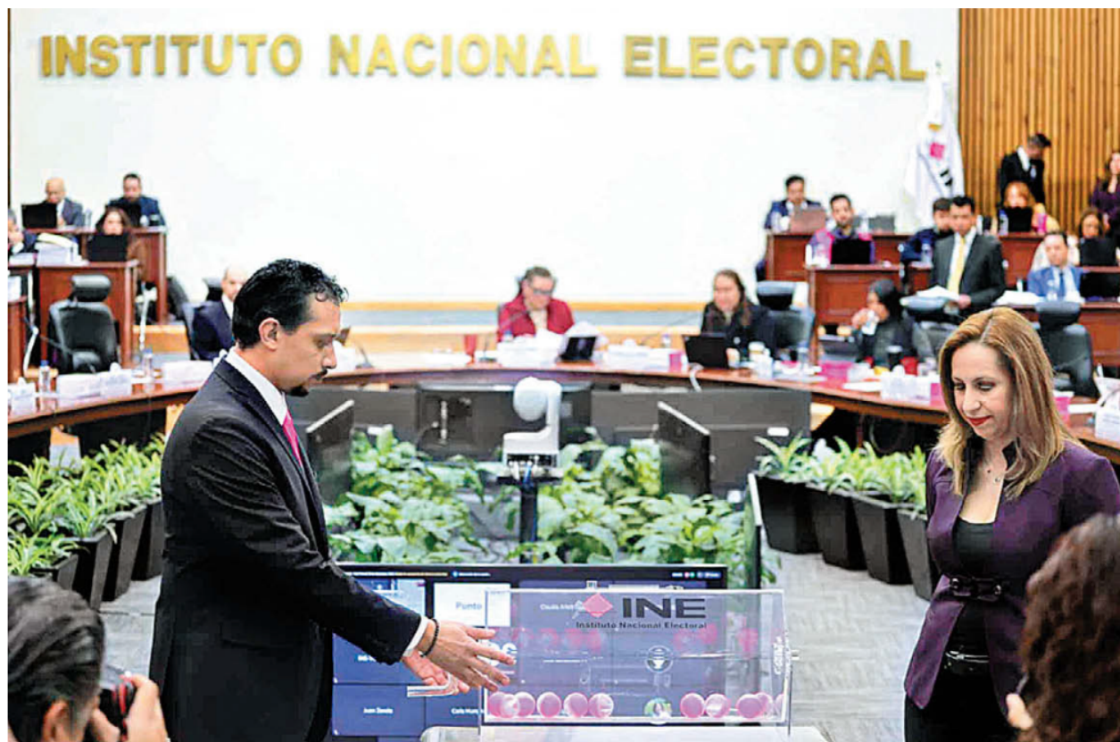
Sorteo realizado durante la sesión del Consejo General del instituto. ESPECIAL