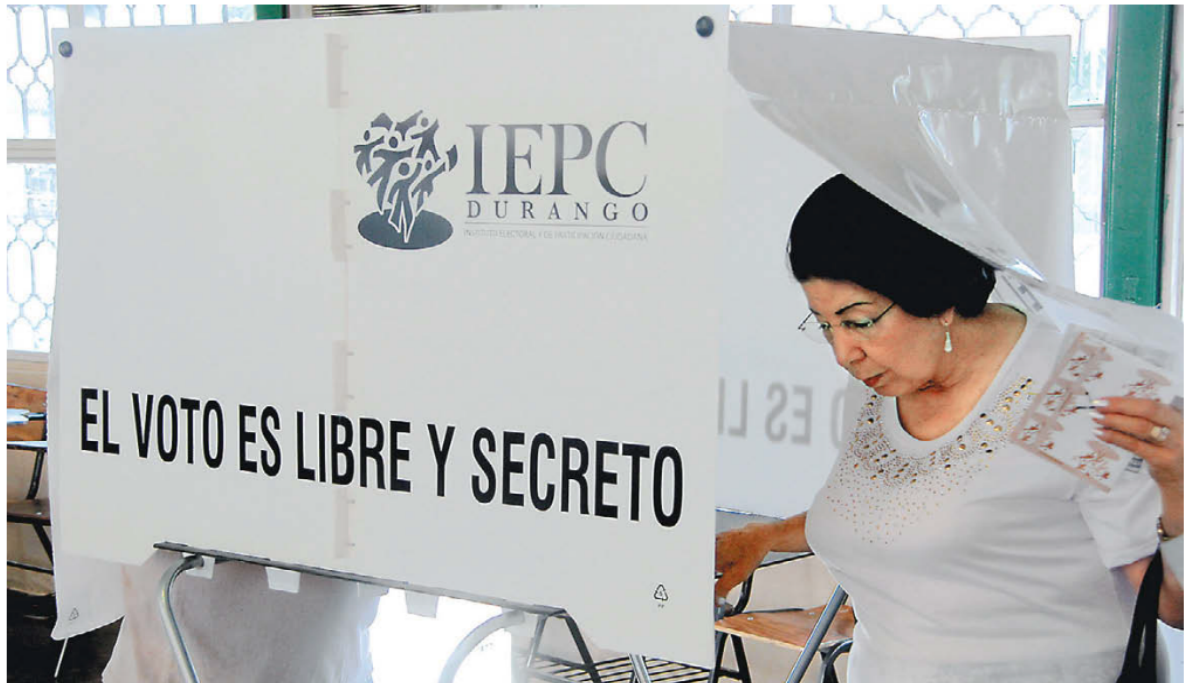
La próxima jornada en la entidad será el primer domingo de junio. ALDO CHAIREZ