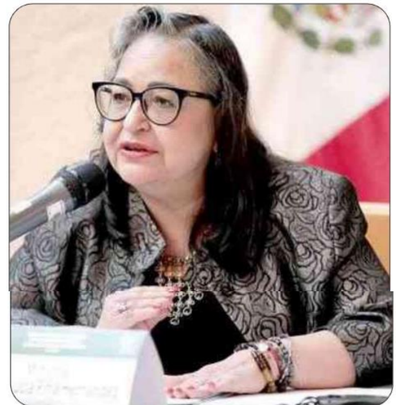
Norma Piña Hernández

"Si logramos este objetivo, será un elemento de redistribución de la riqueza, porque la justicia será expedita, imparcial y sólida para el pueblo de México", reiteró.