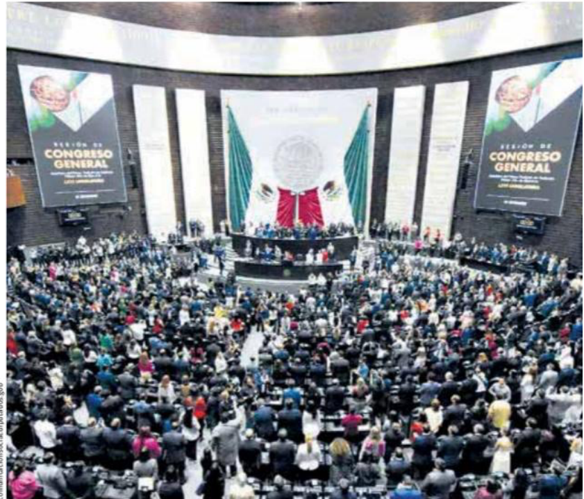
Crece representación de mujeres.

Y la presidenta predica con el ejemplo. De las 20 personas que integran su gabinete diez son