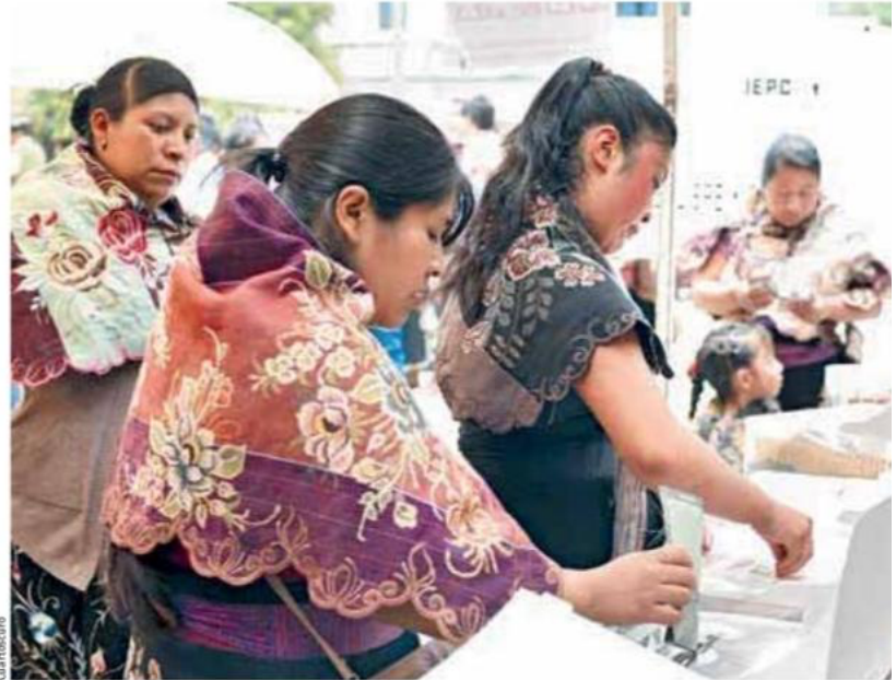
Del derecho al voto, a la presidencia.

Entre las acciones relevantes de su gestión en Colima trascendieron la reforma al Código Penal y Civil local en favor de los hijos de las presidiarias, el abrir oportunidades para que las sexoservidoras pudieran cambiar de actividad laboral y, ante todo, la apertura de espacios para las mujeres en la educación pública, en particular en la universidad de la entidad.