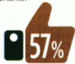
Que sea honesto

Pensando en los atributos de quienes van a ser electos para ocupar cargos en el Poder Judicial, ¿qué es más importante?