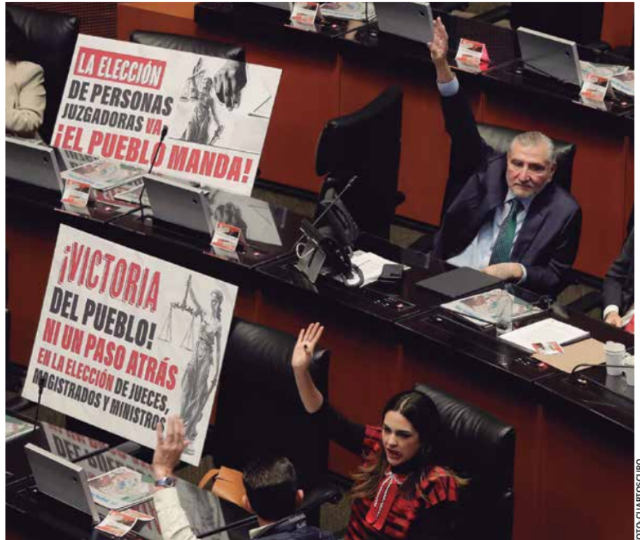
La reforma constitucional que elimina a los órganos autónomos creados en la época neoliberal, es un claro ejemplo del cambio de gobierno que plantea la Cuarta Transformación para México.

3.- Consejo Nacional de Evaluación de la Política de Desarrollo Social