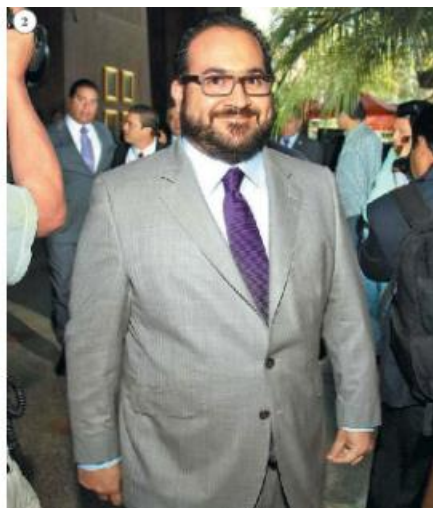
2 El ex gobernador de Veracruz. OCTAVIO HOYOS