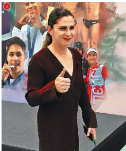
1 Ana Guevara, ex titular de Conade.

El organismo precisó que cerca de 60 por ciento de las carpetas de investigación siguen abiertas, aunque sin respuesta. PÁGS. 6 Y 7