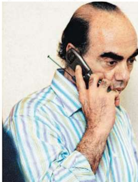
El empresario textilero recuperó 800 mdp.

La unidad prevé más desbloques exprés de cuentas investigadas por crimen organizado