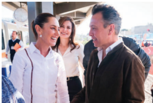
LA PRESIDENTA y el gobernador de Jalisco, ayer.

Sheinbaum anuncia transición en INM y afirma que se transformará; en Jalisco supervisa con Pablo Lemus obras del nuevo Tren Ligero págs. 3 y 5