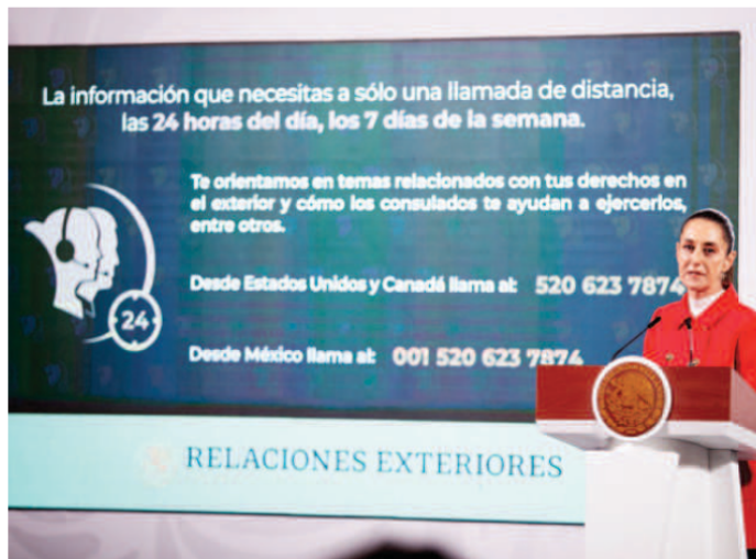
LA PRESIDENTA Claudia Sheinbaum, ayer, en conferencia de prensa.

QUE SEPAN que tienen derechos, que no se puede deportar a una persona tomándola, llevándola a la frontera, sino que tiene que seguirse una serie de procedimientos legales que son procedimientos en EU"