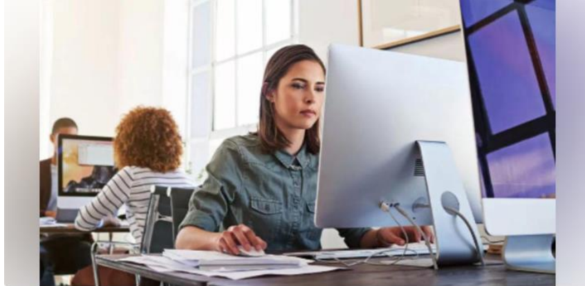
¿Y la jornada de 40 horas? Dictamen aún sin fecha.

Ricardo Monreal , coordinador del Grupo Parlamentario de Morena en la Cámara de Diputados , dijo hace dos meses que la reforma de la jornada laboral de 40 horas , podría ser un “regalo de Navidad” para los trabajadores; dictamen aún sigue sin fecha para aprobarse.