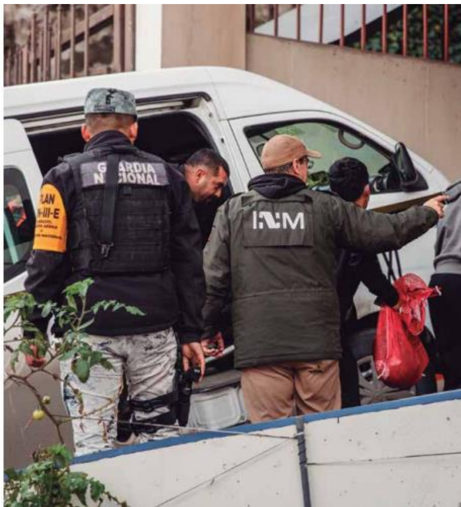
La estrategia implementada por el Gobierno federal constituye el reforzamiento de la red de consulados en la Unión Americana, los cuales apoyarán a los connacionales en Estados Unidos.

Estas acciones reflejan el compromiso del gobierno mexicano para apoyar a nuestros paisanos deportados y garantizar su bienestar al regresar a nuestro país.