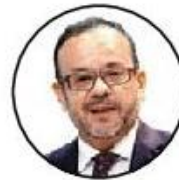
Andrés García Repper

Presidenta del Instituto de Transparencia de Sinaloa