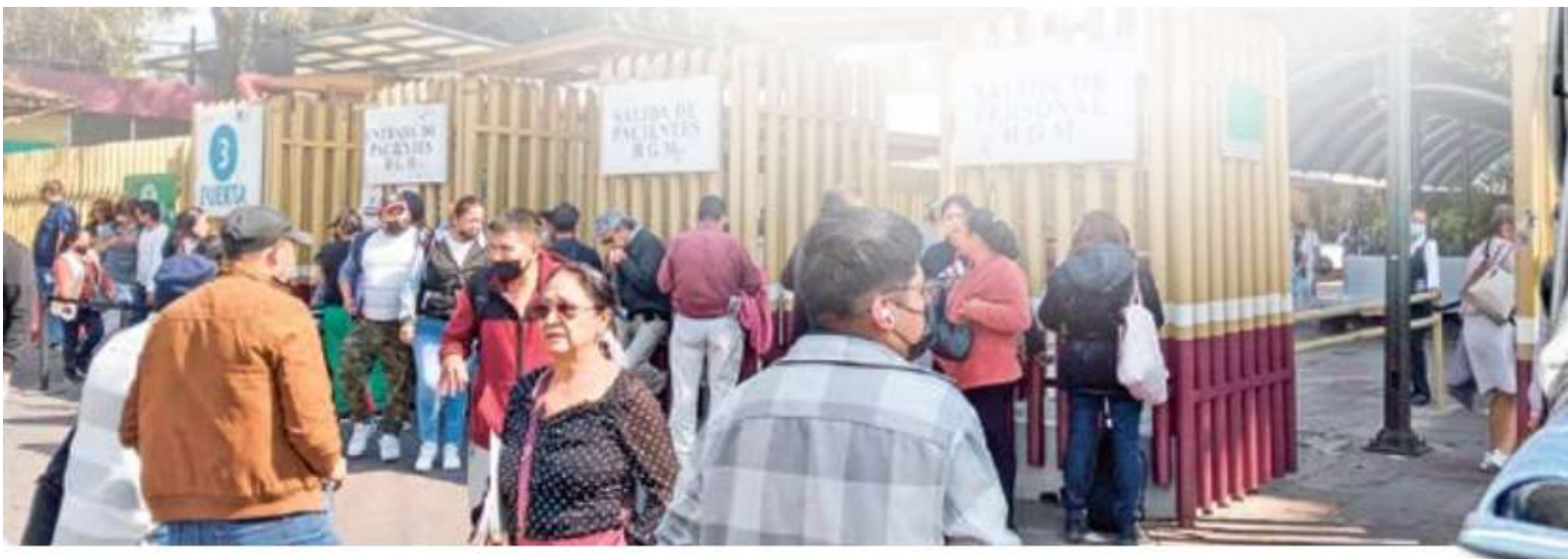
GRÁFICO: XAVIER RODRIGUEZ