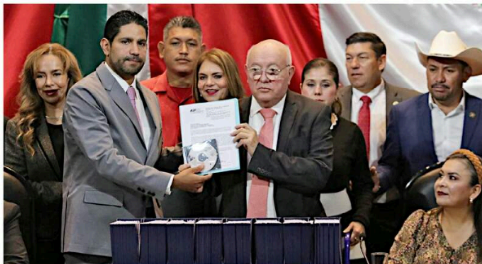
David Colmenares (centro), titular de la Auditoría Superior de la Federación (ASF), entregó ayer en la Cámara de Diputados los resultados de la Cuenta Pública 2023.

Respecto de las observaciones al Gobierno federal, indicó, más del 60 por ciento están relacionadas con