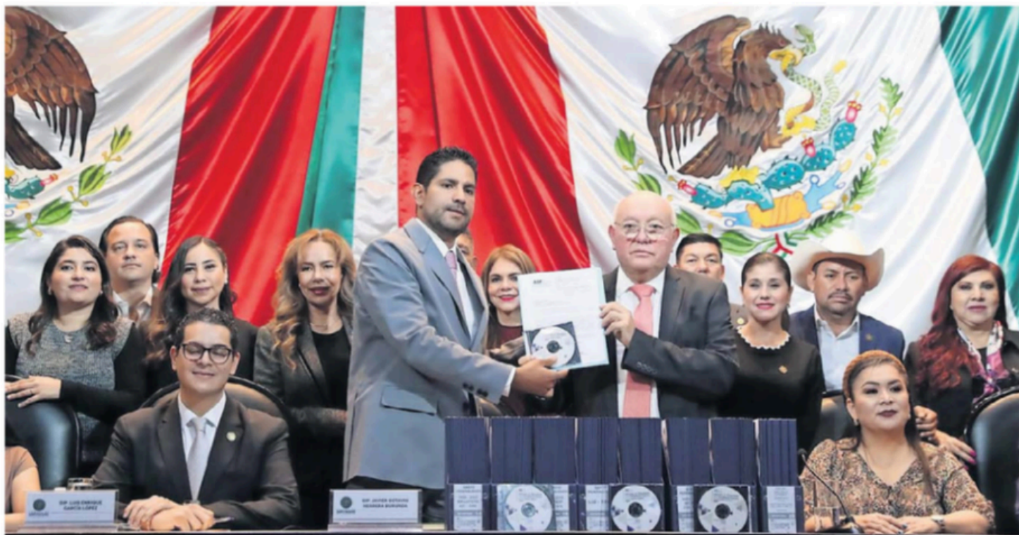
David Colmenares Páramo (derecha), titular de la Auditoría Superior de la Federación, entregó ayer a la Comisión de Vigilancia de la Cámara de Diputados el informe de la segunda fiscalización a la Cuenta Pública 2023.