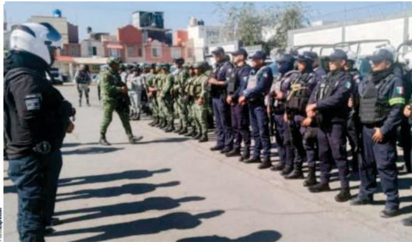
ELEMENTOS del Ejército y de la Policía Estatal, antes de iniciar los patrullajes en Ecatepec, ayer.

hace unos días a la empresa arrendadora, la cual cobraba 20 millones 488 mil pesos al mes.