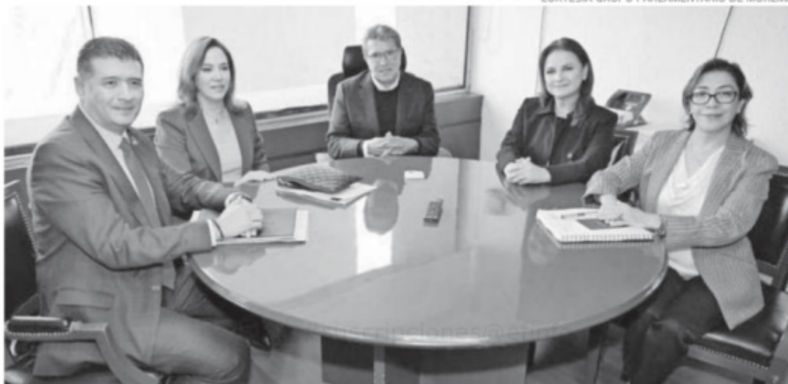
Ricardo Monreal se reunió con los comisionados del Inai en la Cámara de Diputados