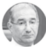
ALBERTO PÉREZ DAYÁN Ministro de la Corte

Trabajadores del Poder Judicial que siguieron la discusión afuera de la Corte mostraron su tristeza y llamaron “traidor” al ministro Pérez Dayán.