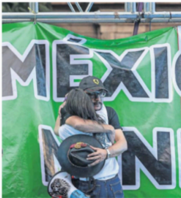
Trabajadores del Poder Judicial rompieron en llanto al conocerse la decisión de la Suprema Corte.

a favor recibió el proyecto contra la reforma judicial en la Corte, en vez de los 8 necesarios para avalarlo.