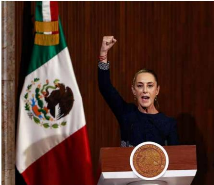
La presidenta Claudia Sheinbaum, durante su mensaje con motivo del 108 aniversario de la Constitución, en el Teatro de la República, Querétaro.

unidad y resistencia ante cualquier intento de vulnerar la soberanía mexicana. La ceremonia, aunque solemne, dejó entrever las tensiones políticas internas, pero también la determinación de un gobierno que busca fortalecer sus principios democráticos en un contexto global cada vez más desafiante.