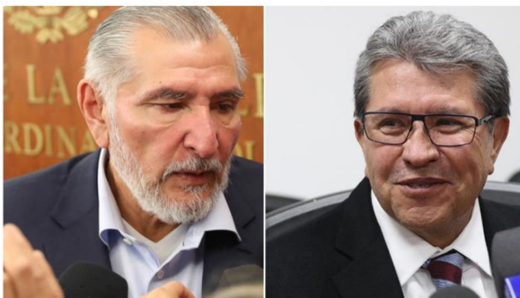
Adán Augusto: no habrá protección para Cuauhtémoc Blanco; se actuará conforme a la ley: Monreal

La solicitud de desafuero contra el exgobernador de Morelos y actual diputado federal, Cuauhtémoc Blanco Bravo, ha llegado a la Cámara de Diputados para su análisis, en un proceso que, de acuerdo con los líderes parlamentarios, se llevará a cabo sin presiones ni intereses políticos.