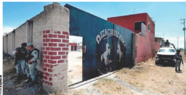
ELEMENTOS de la Guardia Nacional custodian la entrada al rancho Izaguirre, ubicado en la comunidad La Estanzuela del municipio de Teuchitlán, ayer.

Narró que uno de los sobrevivientes le compartió: "Los que alcanzamos a escapar fue porque pasamos el adiestramiento y nos mandaron a la guerrilla