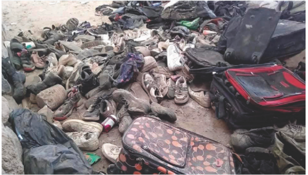
ALGUNOS DE LOS OBJETOS encontrados por colectivos de búsqueda de desaparecidos el pasado 5 de marzo.

En entrevista con la periodista Azucena Uresti, en Radio Fórmula , la activista indicó que los muchachos eran citados en las centrales de autobuses de Tlaquepaque y Zapopan y de ahí los llevaban al rancho referido, en donde eran entrenados como sicarios.