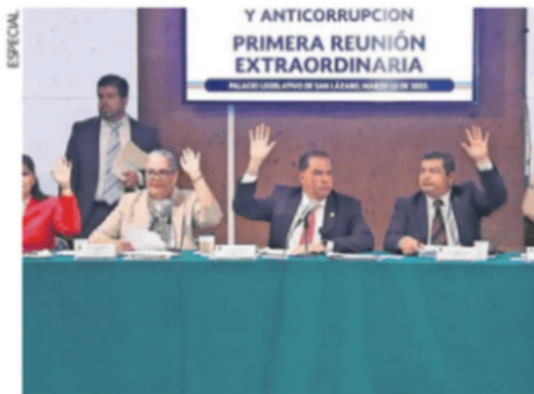
La Comisión de Transparencia y Anticorrupción de la Cámara de Diputados avaló la reforma presidencial.