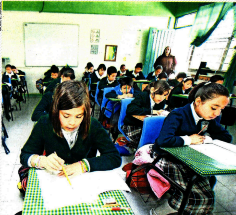
Por primera ocasión, en el ciclo escolar 2024-2025 la SEP desplazó las evaluaciones diagnósticas e implementó los EIA