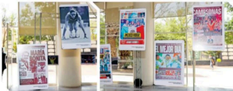
En el Foro hubo muestra de la Fototeca, Hemeroteca y Biblioteca "Mario Vázquez Raña".

1910 AÑO EN QUE SE APROBÓ EL DÍA INTERNACIONAL DE LA MUJER, EN COPENHAGUE