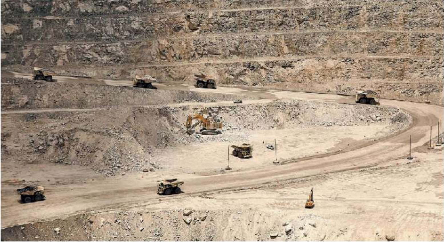
Mina de plata de la empresa Gold Group en el pueblo de Mazapil, Zacatecas.