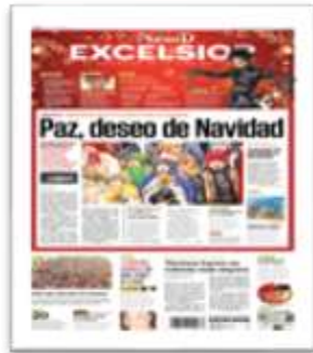
Paz, deseo de Navidad