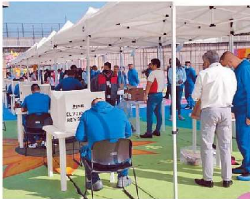
La jornada en cárceles será del 6 al 20 de mayo. ESPECIAL

En estas seis entidades se ubican 42 mil 723 personas que representan 45.4 por ciento del total de los reclusos que se encuentran sin sentencia en las cárceles del país. ■