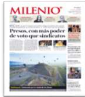
Presos, con más poder de voto que sindicatos