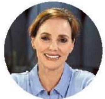
Lilly Téllez PAN