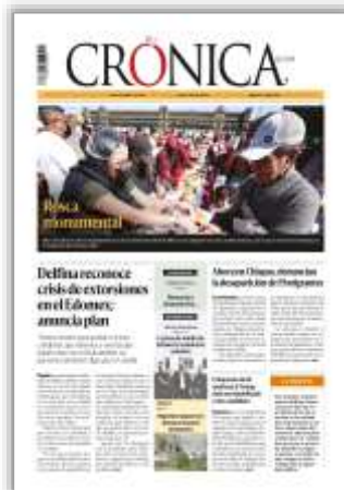
Delfina reconoce crisis de extorsiones en el Edomex; anuncia plan