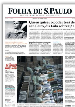
Quem quiser o poder terá de ser eleito, diz Lula sobre 8/1