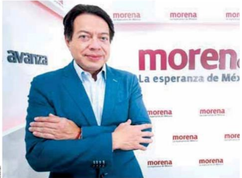
Delgado | Transparencia y democracia.

Primero, puntualizó, la reforma parece beneficiar la comunicación con la ciudadanía y la rendición de cuentas, pero “los partidos son quienes definen quiénes son los nominados; sigue siendo