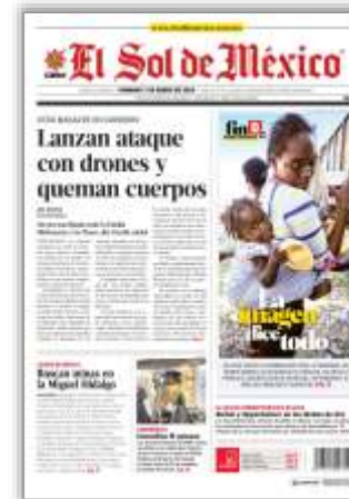
Lanzan ataque con drones y queman cuerpos