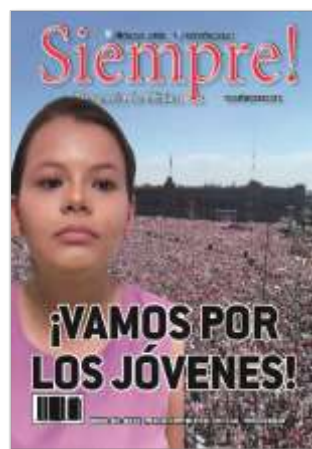
¡Vamos por los jóvenes!