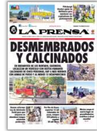
Desmembrados y calcinados