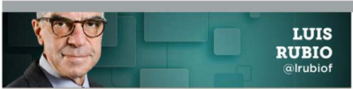
LUIS RUBIO @lrubiof

El próximo gobierno promete ser muy débil, circunstancia que podría remontar si modifica la propensión a pelearse con el Legislativo.