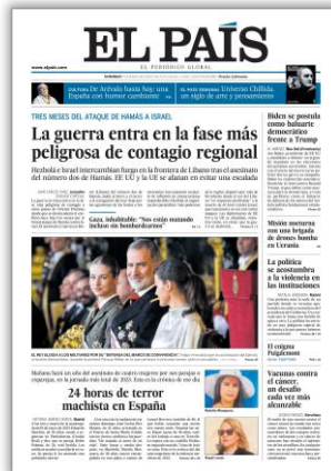
La guerra entra en la fase más peligrosa del contagio regional