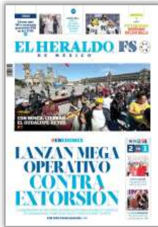
Lanza mega operativo contra extorsión