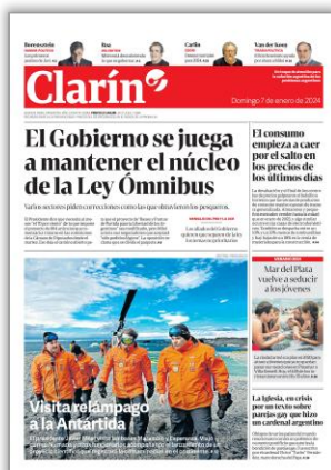
El Gobierno se juega a mantener el núcleo de la Ley Omnibus