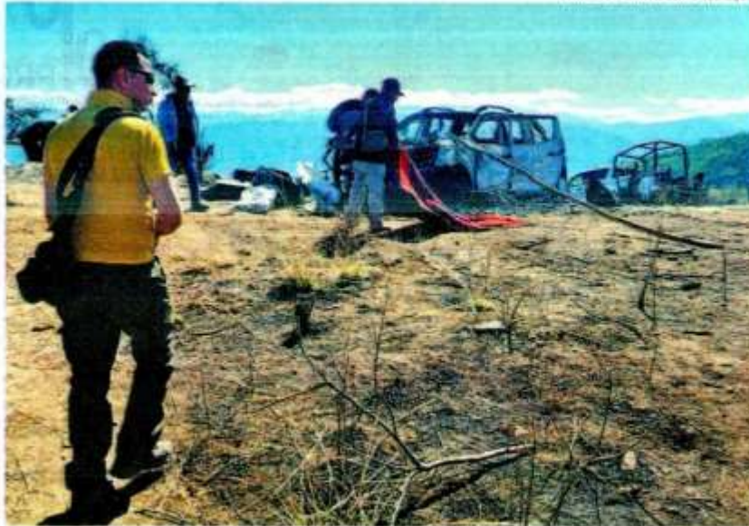
Agentes inspeccionan el lugar del ataque