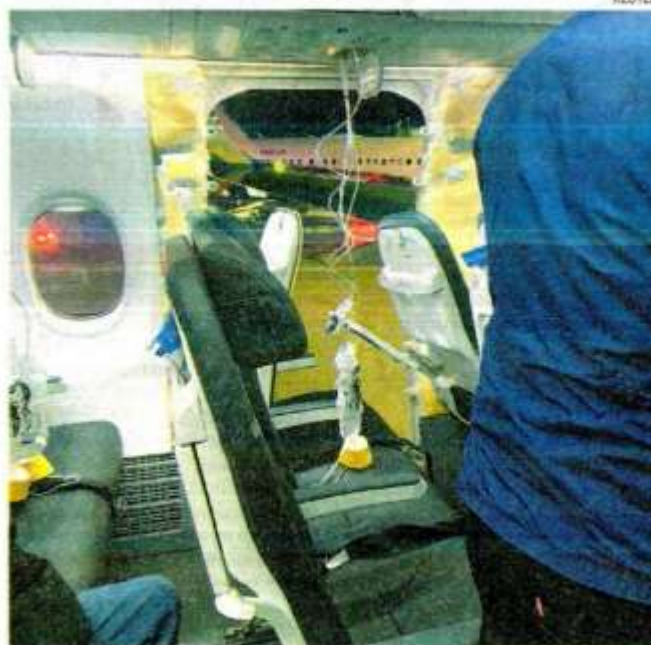
En pleno vuelo se desprendió parte del avión

TIENE un alcance de seis mil 500 kilómetros, alcanzan una velocidad de 842 kilómetros por hora y una capacidad para 178 pasajeros