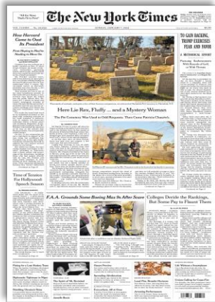
To gain backing, Trump exercise fear and favor