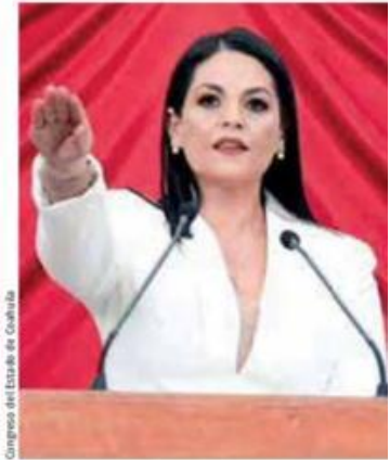
Congreso del Estado de Coahuila

El pasado 1 de enero Coahuila estrenó su nuevo Congreso local, presidido por primera vez en su historia por una mujer, la priista Luz Elena Morales . La mayoría parlamentaria la tendrá la coalición Alianza Coahuila, conformada por 16 legisladores de PRI, PAN y PRD, mientras que Morena contará con cinco y la Unidad Democrática de Coahuila, el PT y el PVEM con un legislador cada uno. Un ejemplo que podría seguir la actual oposición tras la elección de junio próximo en el Congreso federal.