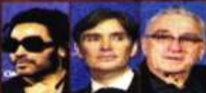
Lenny Kravitz, Cillian Murphy, Robert De Niro

Tras la huelga de guionistas, Hollywood inició su temporada de premios con el Festival de Palm Springs, donde brillaron Margot Robbie y otras estrellas.