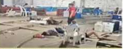
El ataque se registró anoche en la Costa Grande.

REFORMA / STAFF Cinco muertos y al menos 20 heridos es el saldo de un ataque armado ocurrido ayer en un palenque en Petatlán, en la región Costa Grande de Guerrero. De acuerdo con los reportes, alrededor de las 20:20 horas sujetos armados irrumpieron en el lugar donde se llevaba a cabo una pelea de gallos y comenzaron a disparar contra los asistentes. En el lugar se pudo observar a varias personas heridas tendidas en el suelo, según videos que circulan en redes sociales.