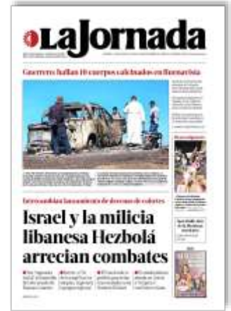
Israel y la milicia libanesa Hezbollah arcrian combates