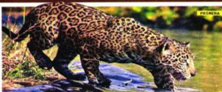
AREA NACIONAL PROTEGIDA DE YAGUAR, OAXACA

CRIMEN AMENAZA A SANTUARIO FELINO Amagos, robos y un incendio provocado por personas que quieren apropiarse del predio donde se ubica Yaguar Xoo, ponen en riesgo la operación de este espacio, en el que se rehabilita a pumas, jaguares, tigrillos y leones abandonados o decomisados. / 13