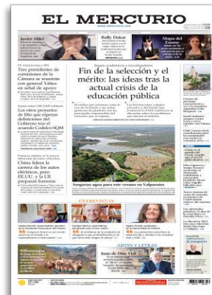
Fin de selección y el mérito: las ideas tras la actual crisis de la educación pública