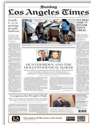
FAA idles some 737 jets for safety checks