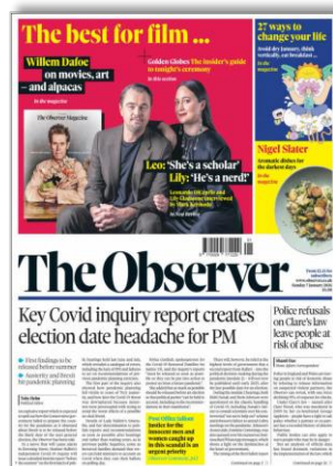
Key Covid inquiry report creates election date headache for PM