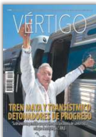
Tren Maya transístmico detonadores de progreso