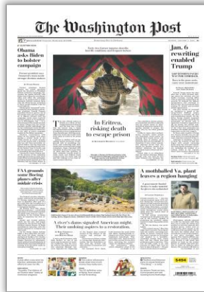
Jan.6 rewriting enabled Trump