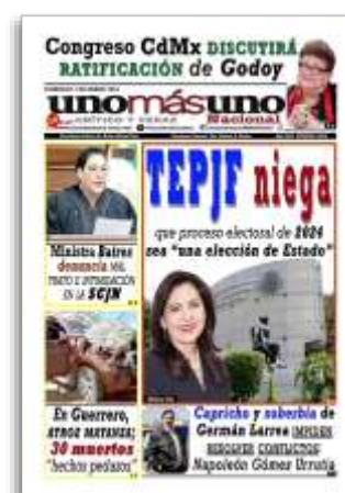
TEPJF niega que proceso electoral del 2024 sea "una elección de Estado"