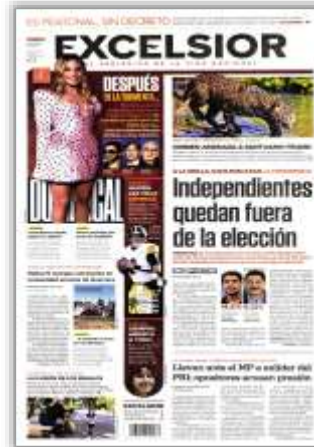
Independientes quedan fuera de la elección