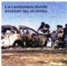
La camioneta donde estaban las víctimas.

El padre Filiberto Velázquez, director del Centro de Derechos de las Víctimas de Violencia Mirerva Bello, dijo que hay seis heridos y 14 desaparecidos luego de un ataque con drones realizado por La Familia Michoacana. La Fiscalía estatal atribuyó la violencia a una disputa entre criminales y precisó que eran cinco los cuerpos hallados; negó tener reportes de heridos o desaparecidos. PRIMERA | PÁGINA 10