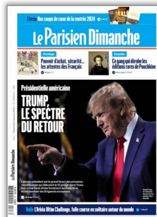
Présidentielle américaine Trump, les spe'tre du retour