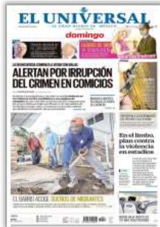
Alertan por irrupción del crimen en comicios