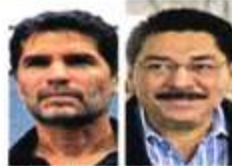
14.47% 6.22% de las firmas de los ciudadanos Eduardo Verastegui. es el nivel de apoyos logrado por Ulises Ruiz.

El último reporte del INE, del 1 de enero, registraba que los más avanzados fueron Eduardo Verastegui, con 14.47% de las firmas necesarias. Le sigue Ulises Ruiz, exgobernador de Oaxaca.