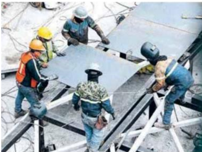
La economía necesita cambios de raíz.

Esto genera una intensa lucha y pone a prueba la democracia del país, que es cotidianamente atacada por la partidocracia que desde hace muchas décadas gobierna. Partidos políticos que, convertidos en auténticas agencias de colocaciones laborales, solo sirven para acercar a sus fieles seguidores a las ollas de oro y el poder.