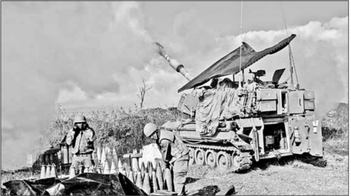
▲ Un tanque israelí bombardea el sur del Líbano desde una posición en Alta Galilea, en el norte de Israel.