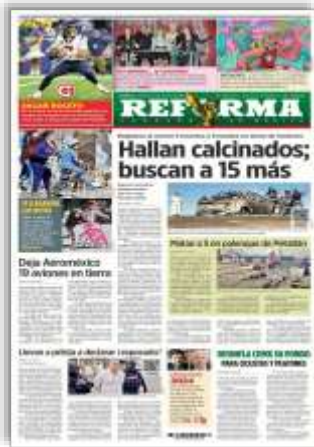
Hallan calcinados; buscan 15 más